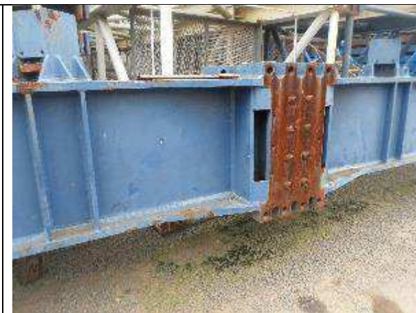
ESTRUTURA DE APOIO C/ BASE PATOLADA