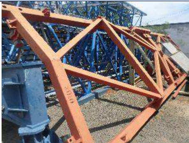
ESTRUTURA C/ LANÇA ROLOS