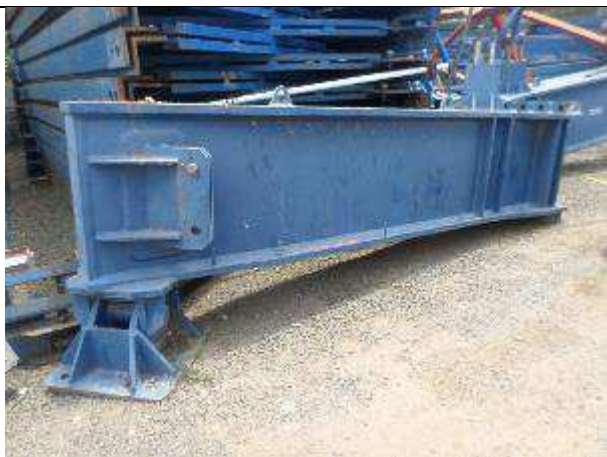
ESTRUTURA C/ PINOS PATOLA