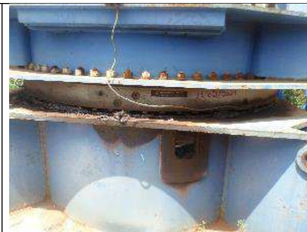
SISTEMA DE GIRO