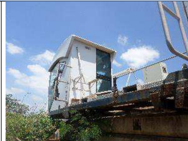
CABINE C/ PLATAFORMA