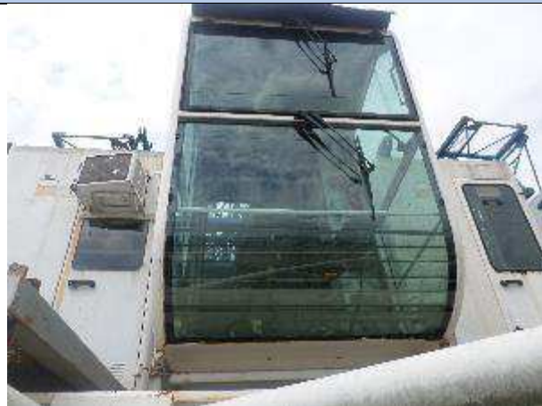
CABINE C/ PLATAFORMA