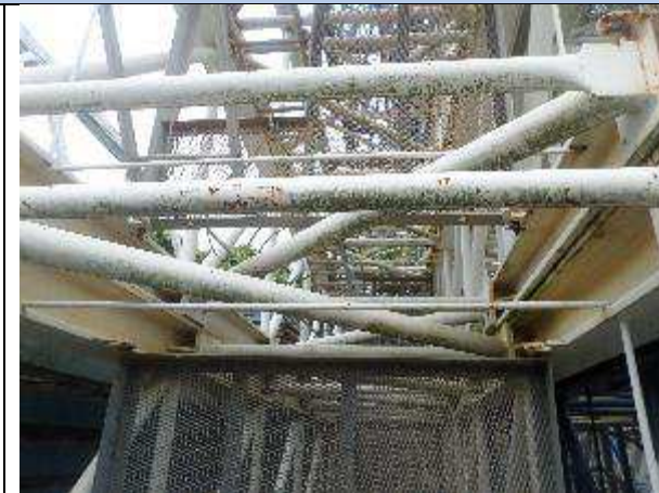
PLATAFORMA DE PISO