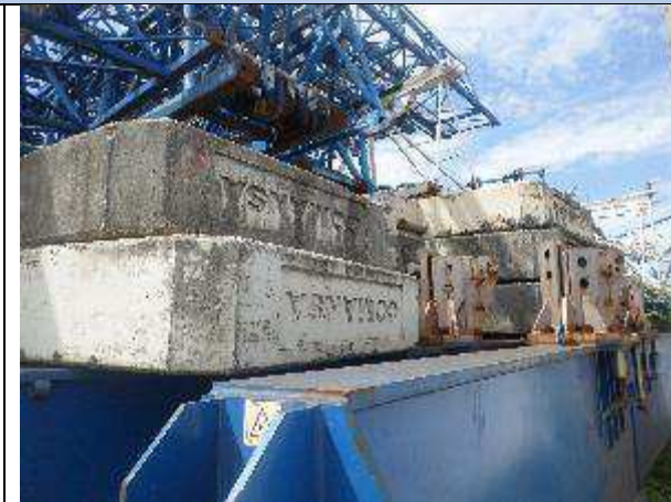
CONTRA PESO EM CONCRETO