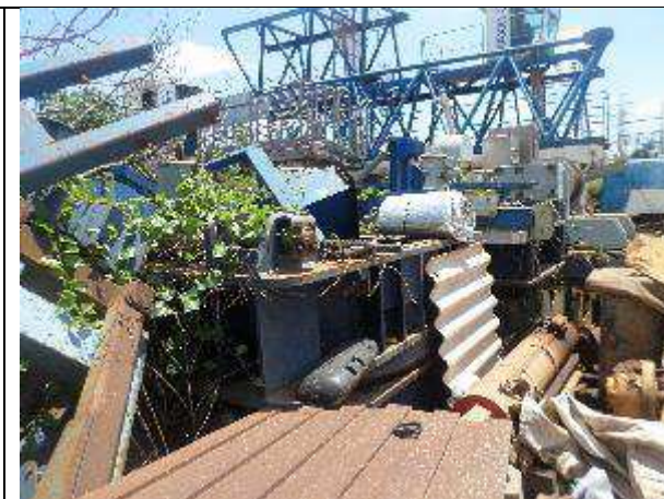
SISTEMA DE GIRO TEREX